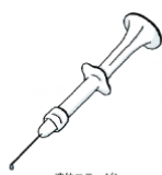
液体コーラーゲン