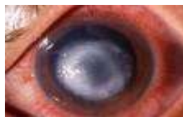
▲アcantアメーバ角膜炎