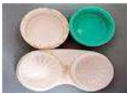
▲不衛生なレンズケース

レンズの洗浄時の「こすり洗い」をしない、不潔なケースに保存、ソフトレンズのケアに水道水を使用など正しいケアが行われていないと、感染症を引き起こす可能性があります。代表的なアcantアメーバ角膜炎は、失明の可能性もある重篤な感染症です！